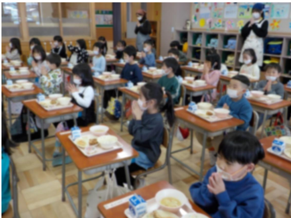
【4月9日（木） 「いただきます！」はじめての給食を味わう1年生】 ※ 6年生にお手伝いをしていただいています。ありがとう6年生！