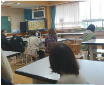
理科室で テレビで参観