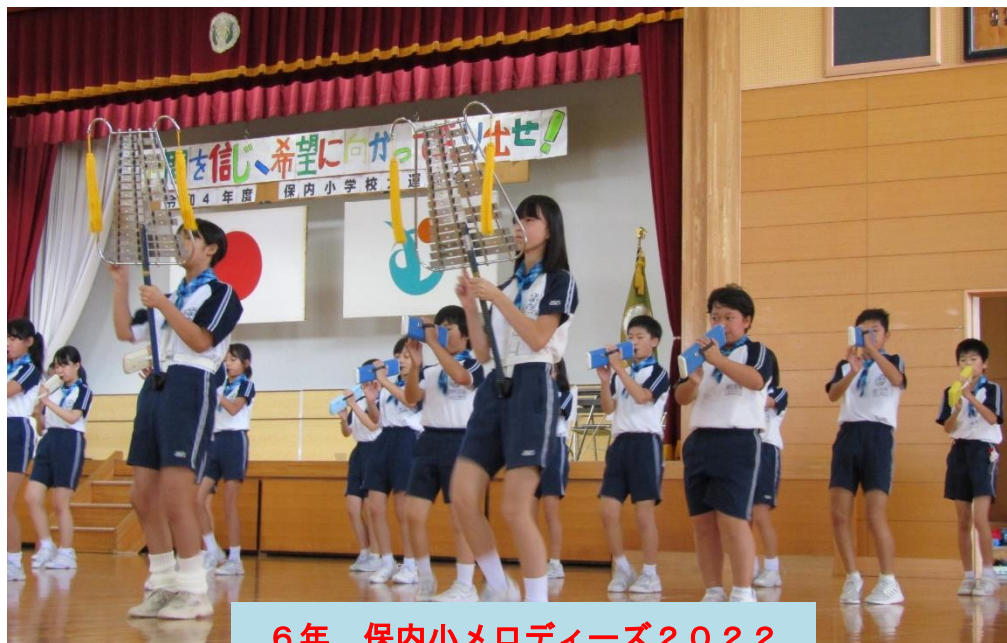
6年 保内小メロディーズ2022