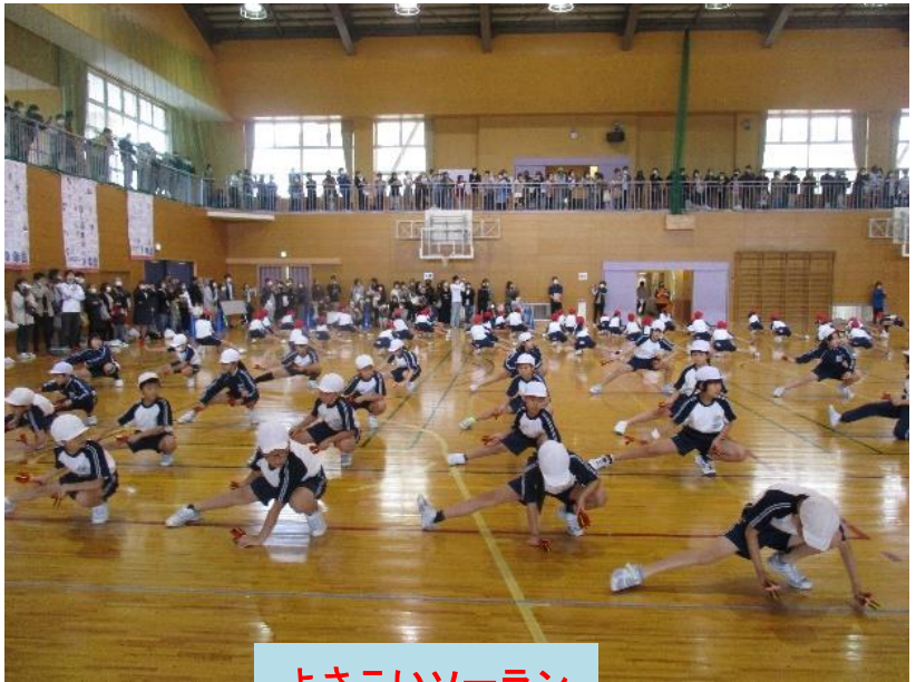
よさこいソーラン