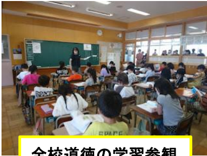
全校道徳の学習参観

7月1日（金）、全校道徳の学習参観でした。子どもたちは自分の考えを積極的に発表していました。今回は災害時の引き渡し訓練も実施したので、ほとんどのご家庭の方がいらっしゃいました。3年生以上の教室はオープンスペースなので保護者の方も教室の中で参観できますが、1、2年生の教室はそれができません。窓を外しましたが、やはり見にくかったことでしょう。教室では、クーラーや扇風機もかけているのですが、熱気で暑かったです。そんな中でも、保護者の方にはマナーよく参観していただきましたこと感謝いたします。