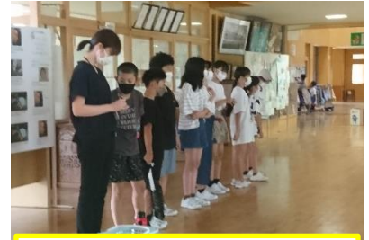
6年生のあいさつ運動

7月は、6年生のあいさつ運動でした。玄関前廊下に並んで、登校する子どもたちに声を掛けてくれました。大きな声で6年生にあいさつを返してくれた人の名前を、お昼の放送で紹介してくれました。「あいさつ がまん あとしまつ」保内小学校のスローガンです。全校児童が大きな声で、あいさつをしています。