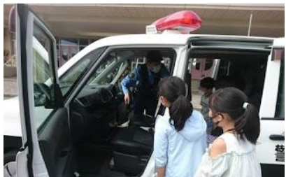
3年生、警察官のお仕事