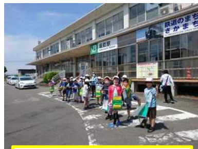
3年生まちたんけん

6月3日(木)、3年生が、坂町駅まで「まちたんけん」に出かけました。途中、薬屋さんの駐車場をお借りして、目の前にある「薬屋」「ラーメン屋」「病院」など、建物の名前を地図に書き込みました。その後、「花屋」「酒屋」「八百屋」を確認しながら、駅に到着しました。駅では、待合室の様子を見学しました。3年生は、汗をかきながらも楽しそうに「まちたんけん」をしていました。