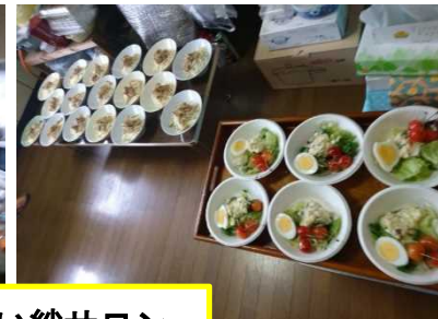
お腹いっぱい絆サロン

6月1日の学校便りで、赤外線検温計6台の寄贈をいただいたことのお知らせしましたが、寄贈者を「(一社)村上市建設業組合」と記載しましたが、「(一社)村上市建設業協会」の誤りでした。お詫びして訂正致します。大変失礼致しました