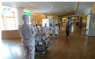
配膳台をいただきます

保内小学校は、給食の配膳台を学級毎に、調理員さんから直接手渡ししていただいています。給食の準備の時間には、それぞれの階から「〇年〇組です。いただきます。」とあいさつので声が聞こえてきます。直接手渡ししていただいて、あいさつをすることは、作ってくださった方々に対する感謝の気持ちが育ってよい取組だと感心しています。