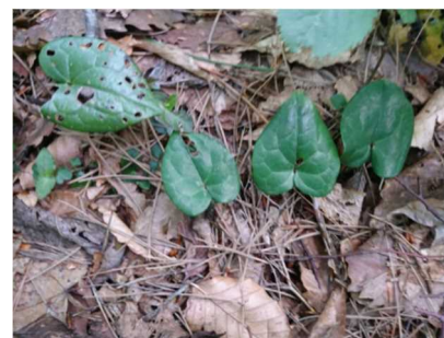
【アラカワカンアオイ】

ョウが卵を産むと教えてくださいました。アラカワカンアオイを校長室に置いて一週間ほどたったら、校長室の中を黒い毛虫が2匹這っていました。パソコンで調べると、何とギフチョウの幼虫でした。今はさなぎになっています。羽化したら、児童に見てもらおうと思っています。