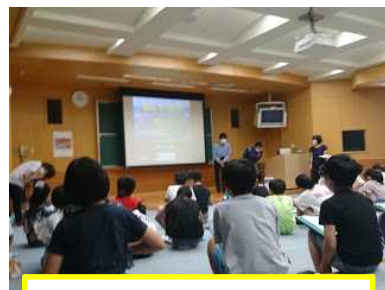
4年生まちたんけん

6月17日(木)、4年生は、羽越河川国道事務所の方においでいただき、荒川の学習をしました。荒川は、新潟県内で3番目の長さを誇る川で、過去には何年もきれいな川日本一になったそうです。4年生は、荒川の学習を深めていきます。