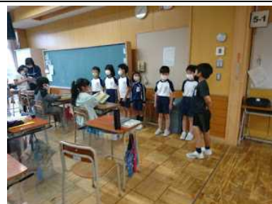
2年生あいさつ運動

6月の第1週は、2年生のあいさつ運動でした。2年生は、グループ毎に朝読書の時間に全ての学級に出かけ「おはようございます。今日1日ががんばりましょう。」と呼びかけました。元気のいい2年生の声で、学校中がやる気がみなぎっています。